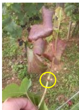
Cicadelle bubale Avec le bourrelet caractéristique au niveau de la piqûre