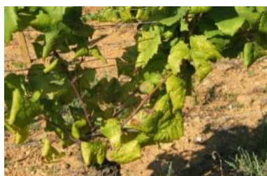
Enroulement (bois aoûtés, nervures vertes)